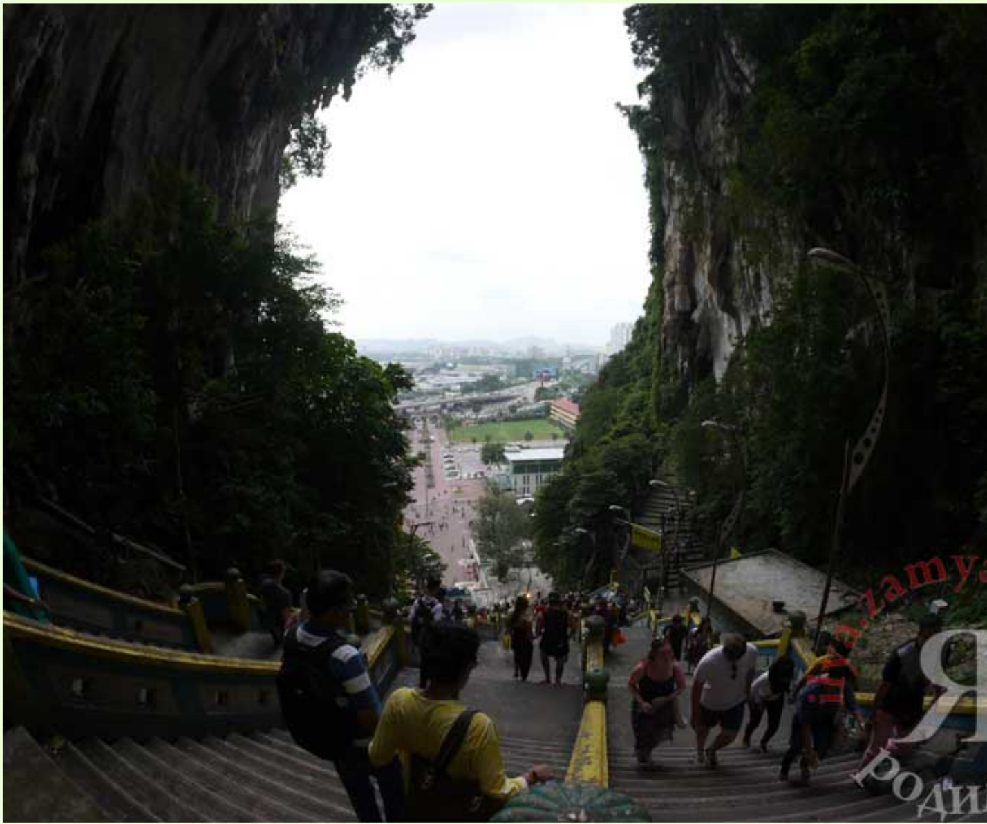
Спуск в долину. Вид на долину с высоты скалы. В долине видны здания, дороги, автомобили, которые в долине водят по своим делам.