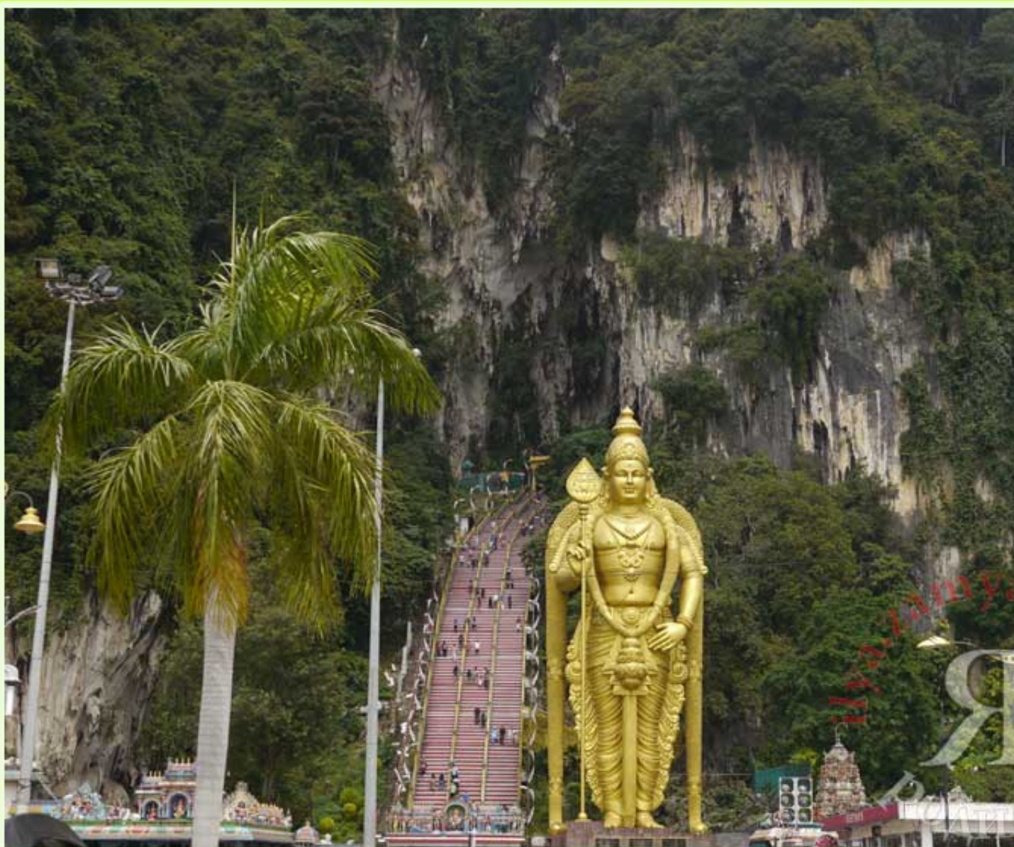
Вид на город, окраина Куала-Лумпур, просто чтобы оценить окрестности: