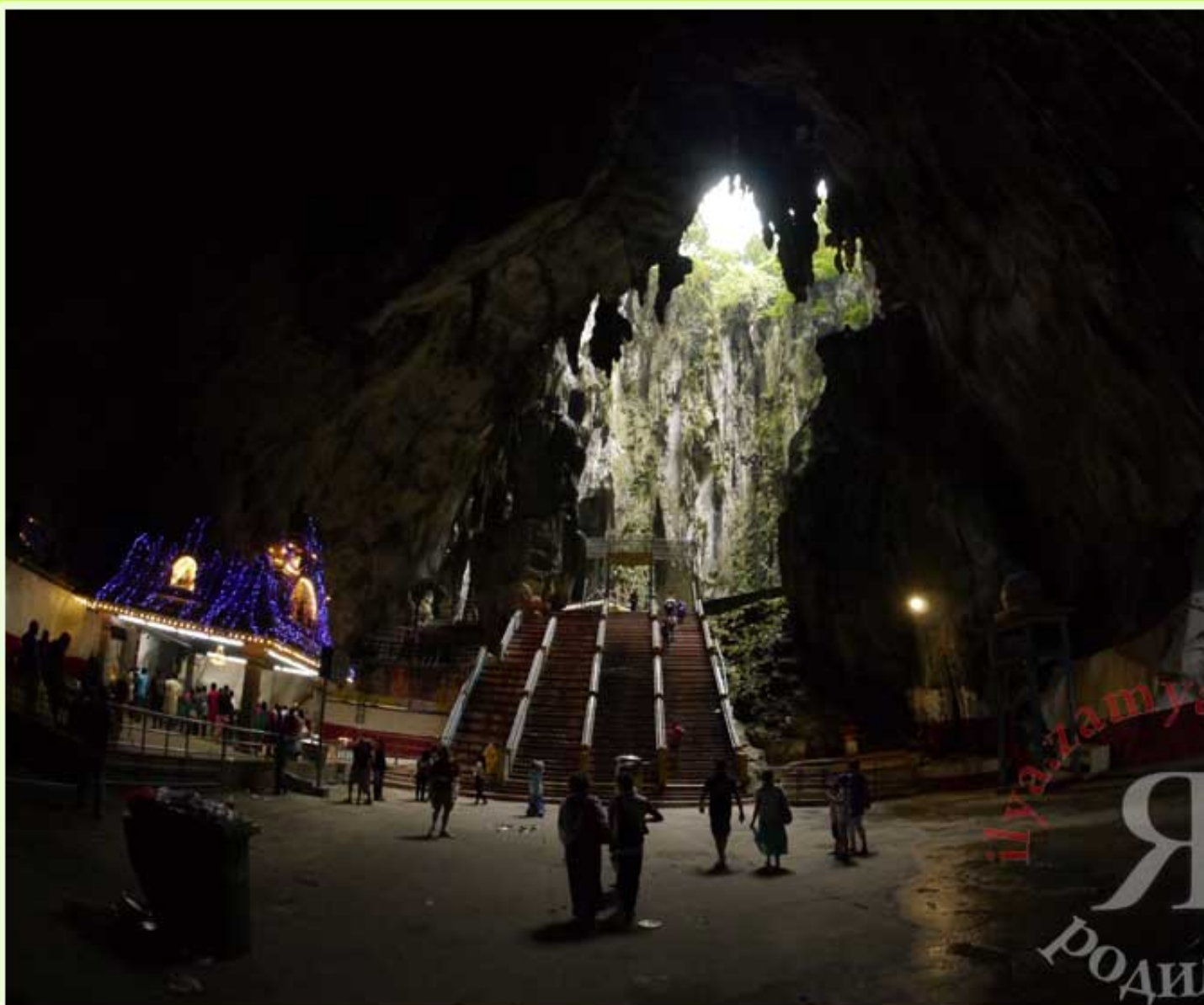
Вид... э... с вершины пещеры?